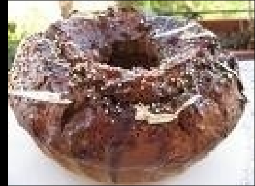
Pani de saba