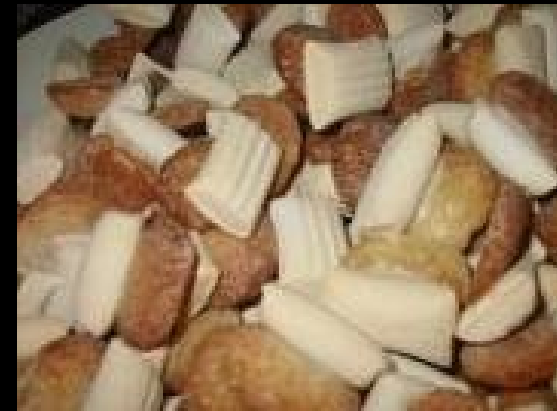
Ossus de mortu